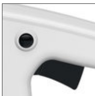
Kettenbremse QuickStop Super (Q)

Die Spannschraube wird seitlich durch den Kettenraddeckel hindurch betätigt. Das verhindert den Kontakt der Hand mit der scharfen Sägekette und den Spitzen des Krallenanschlages.