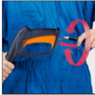
Anti-Drill- und Schnellkupplung

Mit der serienmäßigen Flachstrahldüse mit Druckverstellung werden größere Flächen schnell und effektiv gereinigt (Abb. ähnlich).